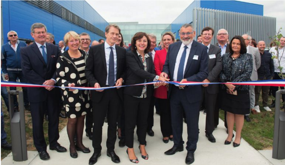
Carole Delga, présidente de la Région Occitanie, coupe le ruban aux côtés d'Arthur Pais. La Région a accordé un soutien de 1,5 M.€ à la construction du bâtiment via le fonds européen FEDER dont elle a la gestion.

Mécanuméric a inauguré de nouveaux bâtiments à Marssac-sur-Tarn destinés à accompagner une forte croissance qui devrait déboucher sur la création d'une cinquantaine d'emplois.