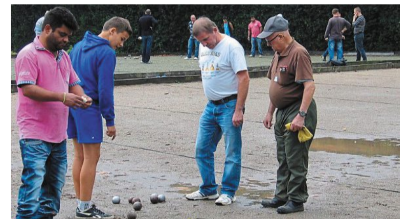
Le concours promet d'excellentes conditions.

Demain samedi 21 septembre, sur les excellents jeux du stade municipal, la Pétanque nogentaise organise un concours en doublettes ouvert à tous. Inscriptions à partir de 13 h 30, jet du but à 14 h 30.