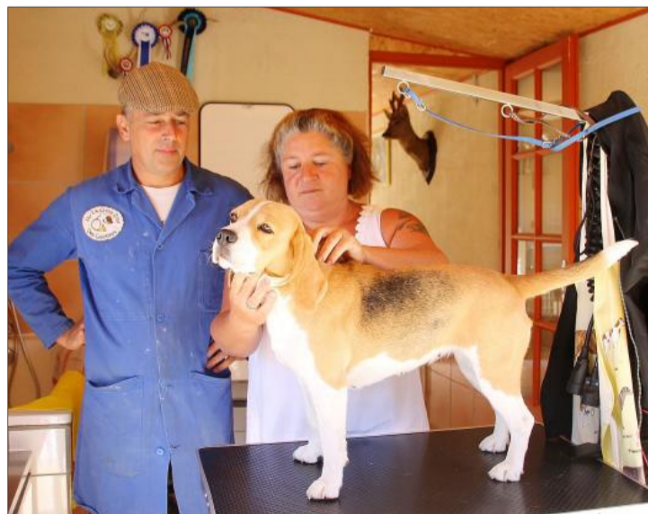
Une nurserie équipée pour les soins éventuels mais aussi les tatouages.

de travail permettent les meilleures conditions d'hygiène requises.» De nombreuses coupes ornent la nurserie, elles ont été gagnées lors de concours de beauté canine. «Il m'est arrivé même d'aller en Belgique, en Espagne, mais surtout au Championnat de France.» Cette année, en juin à Villepinte en Seine-Saint-Denis, «Dialynne de Best Secret», deux ans, acquise en Angleterre, a remporté le 3 e prix Cacib, certificat d'aptitude au championnat international de beauté, dans la classe ouverte femelle.