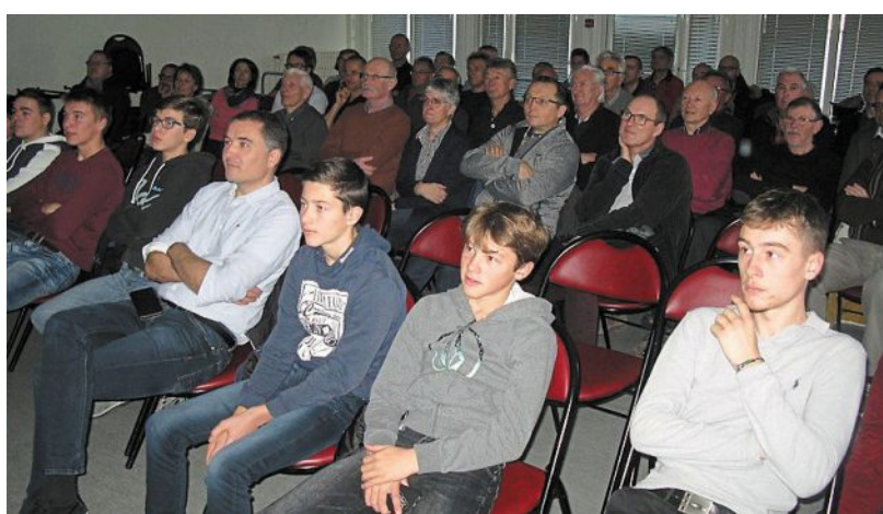
Les adhérents du club des Cyclo-randonneurs se sont retrouvés dimanche, pour leur assemblée générale.