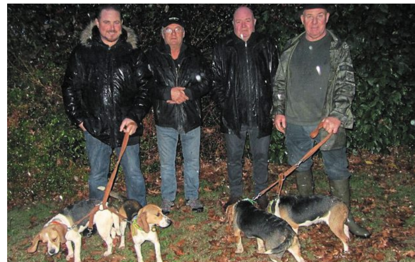
Les membres de la Société de chasse, avec quatre beagles, identiques à ceux présentés dimanche sur les terrains du Rohu

Une présentation de chasse avec des chiens sera montrée au grand public, dimanche, à Lanester, dès 9 h 30.