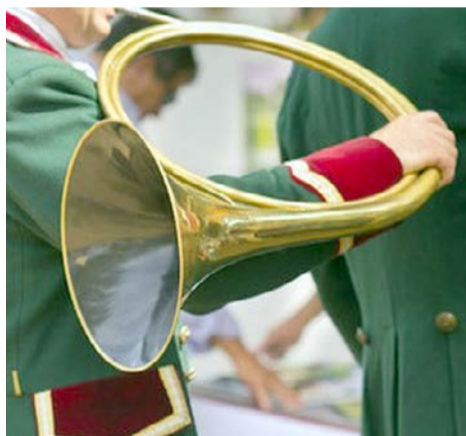
Un cor de chasse.