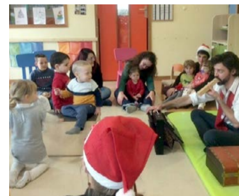
Un spectacle plein de poésie en attendant le Père Noël.