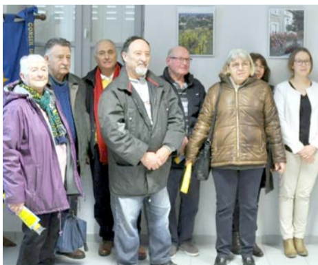
Le maire, les stagiaires et les intervenants.